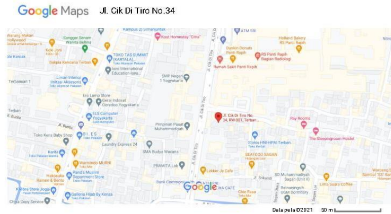
Gambar 1.1 Peta lokasi PT. Global Data Inspirasi