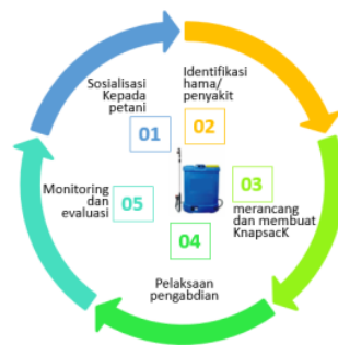
Gambar 1. Tahapan Kegiatan Pengabdian Kepada Masyarakat

Tahapan kegiatan pelaksanaan dalam pengabdian kepada masyarakat terdiri dari lima tahapan, antara lain: sosialisasi kepada petani, identifikasi hama/penyakit, merancang dan membuat Knapsack berbasis mikrokontroler, pelaksanaan pengabdian kepada masyarakat dan monitoring-evaluasi, seperti yang ditunjukkan pada Gambar 1.