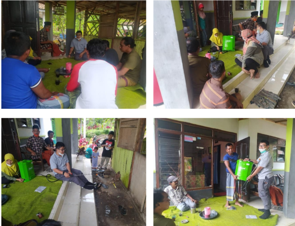
Gambar 3. Penyuluhan Pengendalian dan Pemanfaatan Alat Semprot Power Sprayer

Pada Gambar 3 di atas ini tujuannya memberikan pengarahan dalam penggunaan power sprayer tepat guna dalam menunjang Produksi Kopi di Desa Klungkung, Sukorambi, Jember. Diharapkan dengan adanya alat semprot power sprayer ini dapat mengurangi beban petani kopi dalam memelihara dan merawat tanaman kopi mereka agar produksi kopi semakin meningkat.