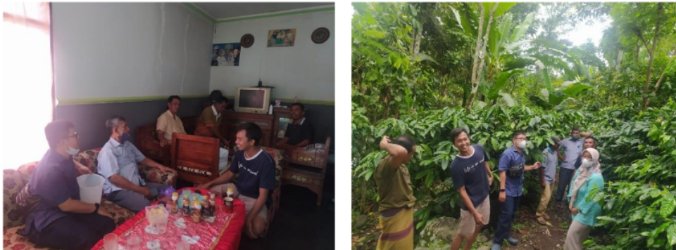
Gambar 2. Kegiatan Penyuluhan Kopi di Desa Klungkung

Pada Gambar 2. ini kami memberikan penyuluhan mengenai teknik budidaya kopi yang baik untuk meningkatkan produksi kopi, serta dengan memberikan sarana dan teknik ini diharapkan warga Klungkung dapat memahami bagaimana membudidayakan kopi dengan baik. Kemudian kami langsung memperlihatkan jenis kopi dan apa saja yang harus diperhatikan dalam budidaya kopi.