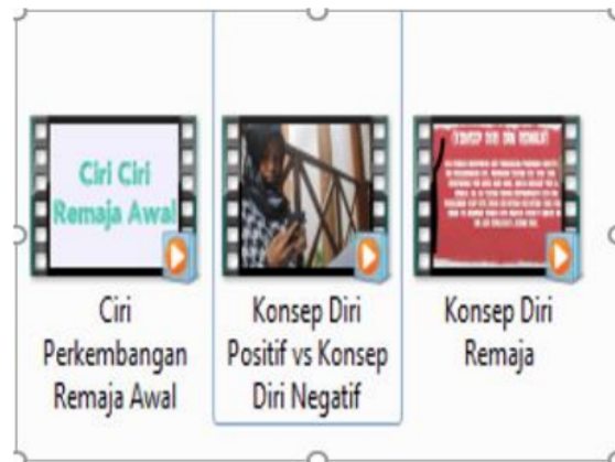
Gambar 3. Materi youtube

Pemberian materi selanjutnya adalah tentang penyakit menular seksual (HIV/AIDS) pada remaja (menggunakan power point), dan dilanjutkan dengan video dokumenter dan video animasi tentang HIV/AIDS.