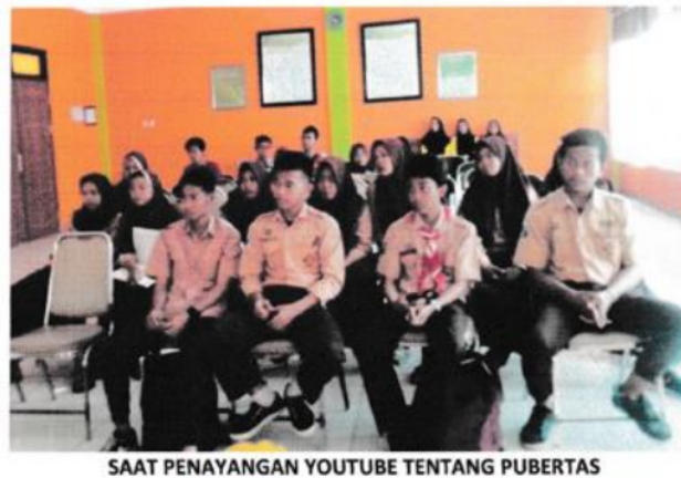
Gambar 5. Materi Youtube pengenalan HIV/AIDS dan video dokumenter