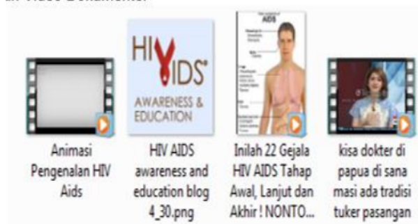
Gambar 4. Materi Youtube pengenalan HIV/AIDS