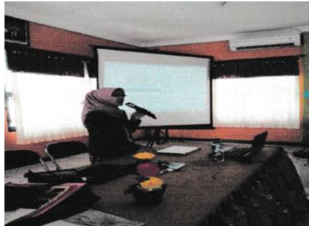
Gambar 1. Pembukaan acara penyuluhan cara menyikapi pubertas pada remaja di Puskesmas Benowo Pemerintah Kota Surabaya

Pembukaan dilakukan dengan memperkenalkan diri dan pembacaan kurikulum vitae fasilitator dan peserta.