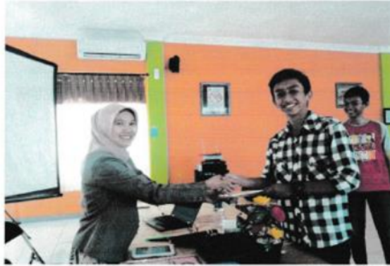
Gambar 7. Pemberian cenderamata kepada peserta nilai post test terbaik

Gambar 7 adalah pemberian cenderamata kepada peserta nilai terbaik. Pemberian pendidikan kesehatan melalui kegiatan ceramah dan dikombinasi dengan pemutaran video dokumenter ternyata mampu meningkatkan pengetahuan remaja.