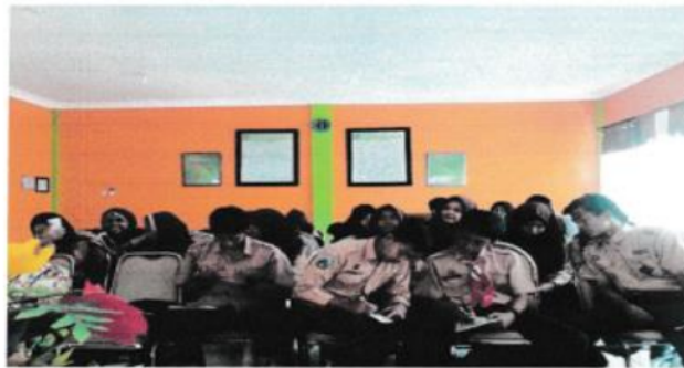
Gambar 6. Suasana saat Pengisian Identitas di lembar jawaban Post Test

Pada akhir kegiatan dilakukan evaluasi berupa post-test . Evaluasi kegiatan ini dilakukan dengan cara memberikan soal post test sebanyak 10 soal. Soal post test ditayangkan pada slide power point yang telah diatur waktunya, setiap 1 menit slide akan berganti ke pertanyaan berikutnya.