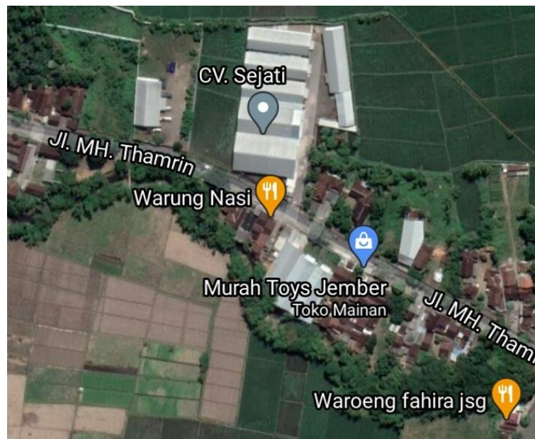
Gambar 2.1 Peta Lokasi PT. Intidaya Dinamika Sejati atau CV Sejati Sumber : GoogleMaps 2020