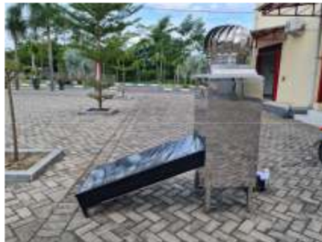
Gambar 1. Alat Pengering Hybrid

Petani kopi rakyat tidak memiliki pengetahuan dan teknologi mengenai proses produksi kopi yang baik, sehingga kualitas kopi yang dihasilkan kurang cukup bagus yang membuat harga kopi rakyat memiliki nilai jual yang rendah. Petani kopi rakyat selama ini pada proses pengeringan kopi hanya menggunakan pengeringan tradisional, diharapkan dengan adanya alat pengering hybrid ini dapat membuat kualitas kopi rakyat menjadi lebih baik.