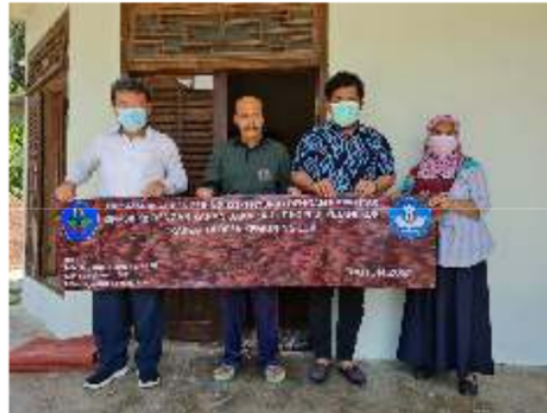
Gambar 2. Kegiatan Pelatihan Penggunaan Alat Pengering Hybrid

Pelatihan ini dimulai dengan pemberian materi mengenai pengolahan kopi yang baik dan benar sesuai dengan standar SNI. Kegiatan ini kemudian dilanjutkan dengan pelatihan tata cara penggunaan alat pengering. Kegiatan Pelatihan Penggunaan Alat Pengering Hybrid ini diawali dengan pemberian materi mengenai metode pengeringan. Dimana metode pengeringan yang coba diperkenalkan adalah sistem pengeringan hybrid, dimana petani dapat menggunakan tenaga gas ataupun tenaga matahari sebagai bahan bakar alat pengering.