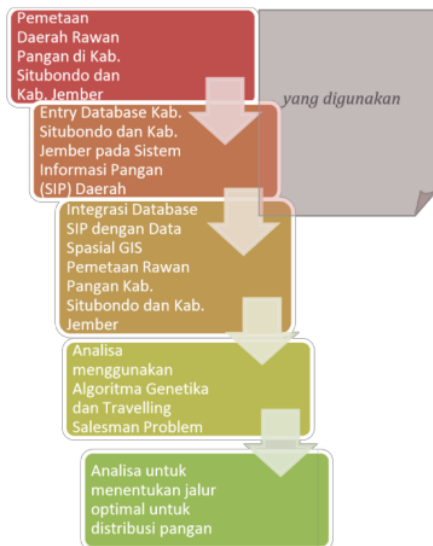
Gambar 2 Metode Penelitian Tahun Kedua

Naskah yang ditulis untuk KURSUS meliputi hasil pemikiran dan hasil penelitian di bidang Informatika dan Teknologi Informasi. Naskah harus diketik rapi pada kertas A4 sepanjang maksimum 14 halaman (satu kolom) dan setiap lembar tulisan harus diberi nomor halaman. Penulisan naskah menggunakan huruf Times New Roman ukuran 12 poin, dengan margin kanan 2 cm, margin kiri 3 cm, margin atas 2 cm, dan margin bawah 3 cm, serta format dengan 1.5 spasi. Berkas ( file ) dibuat dengan menggunakan Microsoft Word . Naskah dapat dikirimkan sewaktu-waktu melalui email ke alamat: kursor@if.trunojoyo.ac.id .