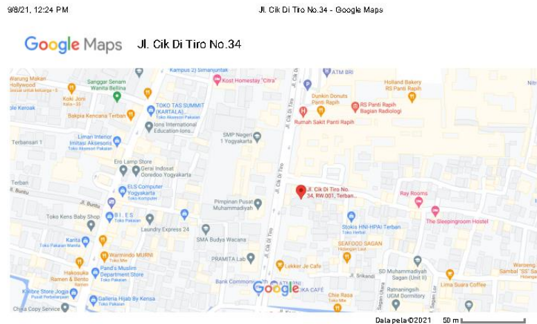
Gambar 1.3 Peta lokasi PT Global Data Inspirasi

Lokasi kegiatan Praktik kerja Lapangan yaitu berada di Kantor PT. Global Data Inspirasi di Jl. Cik Di Tirto No. 34, Terban, Gondokusuman, Kota Yogyakarta, D.I. Yogyakarta (55223)