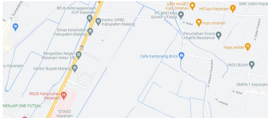
Gambar 1. 1 Peta Lokasi Dinas Kominfo Kab. Malang

Adapun denah lokasi kantor Dinas Komunikasi dan Informatika (Kominfo) Kabupaten Malang yang bergabung dengan kantor Bupati Kabupaten Malang seperti pada gambar 1.1.