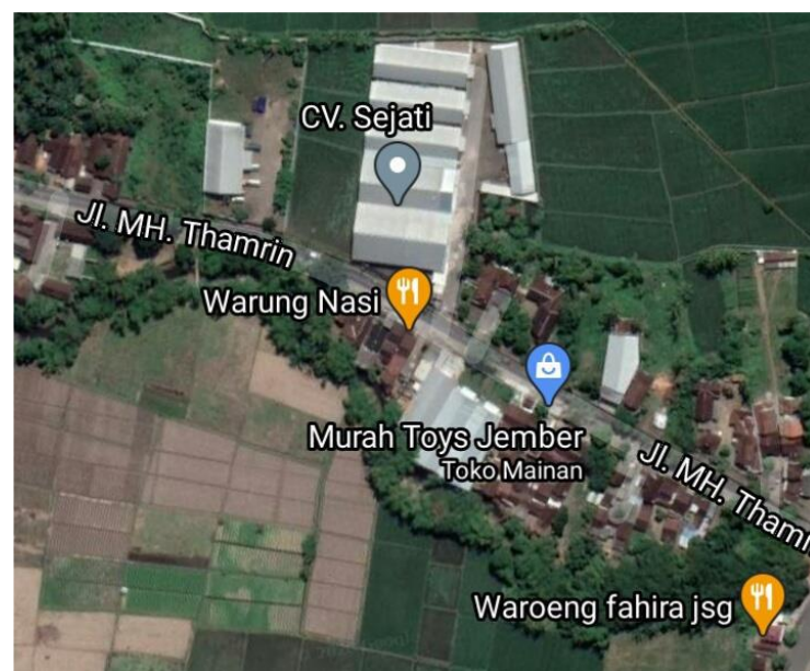
Gambar 1. 1 Peta Lokasi PT Intidaya Dinamika Sejati/CV Sejati (Google Maps, 2021)