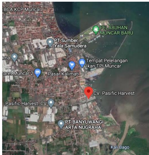
Gambar 1.1 Peta Lokasi CV. Pasific Harvest