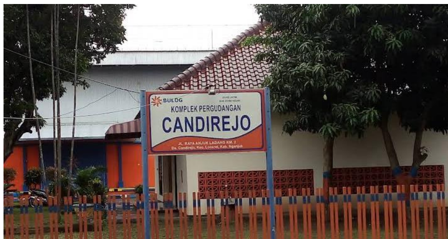
Gambar 1.2 GBB Candirejo Kec.Loceret, Kab.Nganjuk