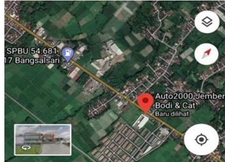
Gambar 1.1 ( Lokasi Auto2000 Cat dan bodi jember)

Adapun peta, denah dan tata letak lokasi PT. Astra International Tbk, Toyota-Auto2000 cat dan Bodi Jember dapat dilihat pada gambar 1.1 dan 1.2.