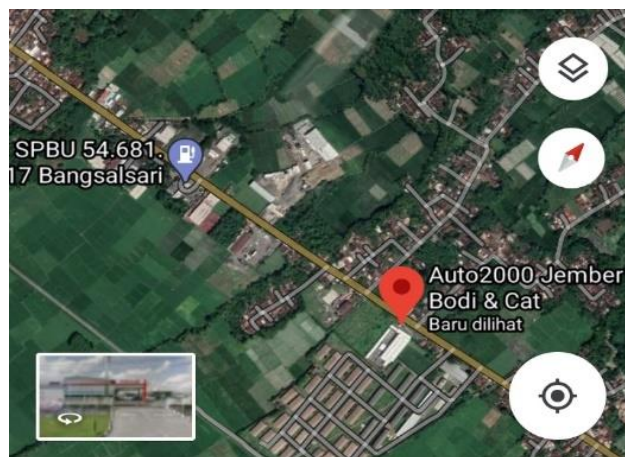
Gambar 1.1 ( Lokasi Auto 2000 Cat dan bodi jember)

Adapun peta, denah lokasi PT. Astra International Tbk, Auto 2000 BP Jember dapat dilihat pada gambar 1.1