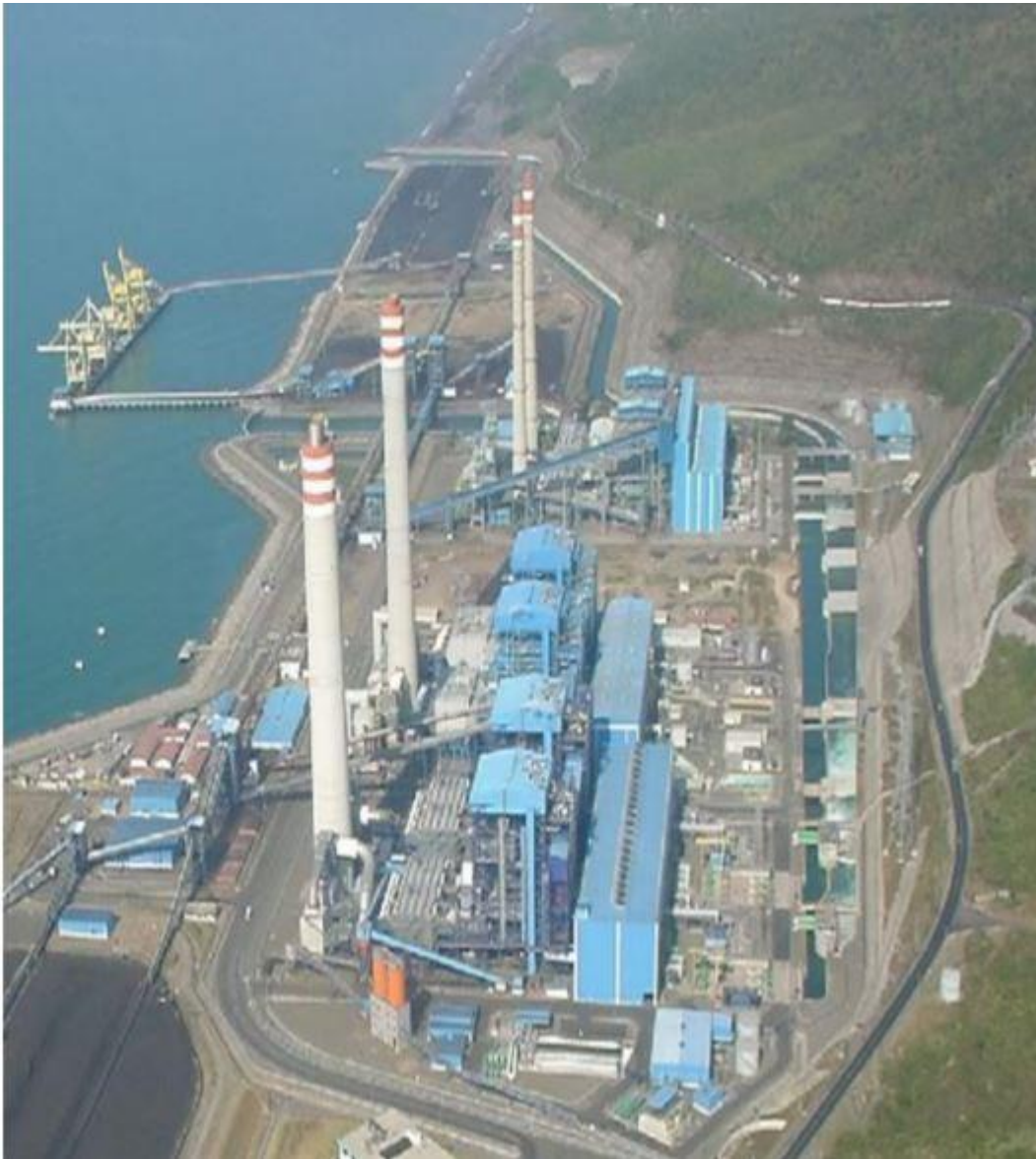
Gambar 1.1 Lokasi PT Paiton operation and maintenance Indonesia

PT Paiton Energy merupakan salah satu unit pembangkit tenaga listrik milik salah satu perusahaan listrik swasta. PT Paiton Energy adalah Perusahaan Pembangkit Swasta (Independent Power Producer) pertama di Indonesia.