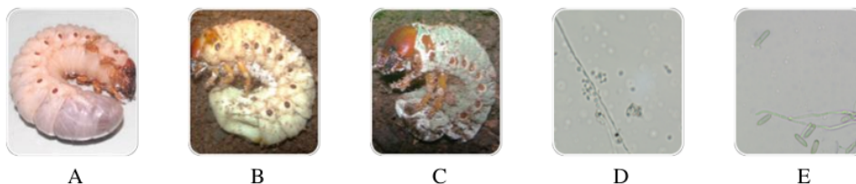
Gambar 1. (A) Larva O. rhinoceros sehat, (B) terinfeksi B. bassiana , (C) terinfeksi M. anisopliae , (D) konidia B. bassiana , (E) konidia M. anisopliae

Bedah kadaver yang terinfeksi B. bassiana dilakukan pada hari ke 9 setelah kematian serangga uji dan bedah kadaver M. anisopliae dilakukan pada hari ke 7 setelah kematian serangga uji untuk memastikan kematian serangga uji akibat infeksi cendawan entomopatogen. Hasil isolasi dan pemurnian dari kadaver terinfeksi kemudian diidentifikasi secara mikroskopis menunjukkan bahwa terdapat hifa dan spora B. bassiana (gambar 1 D). Hifa dan spora M. anisopliae juga terdeteksi pada identifikasi mikroskopis (gambar 1 E). Morfologi hifa dan konidia sama seperti hasil laporan (Herlinda et al. , 2020), dimana konidia B. bassiana bersel satu dan berbentuk bulat sedangkan konidia M. anisopliae berbentuk silindris serta bersel satu (Agastya, dkk., 2018).