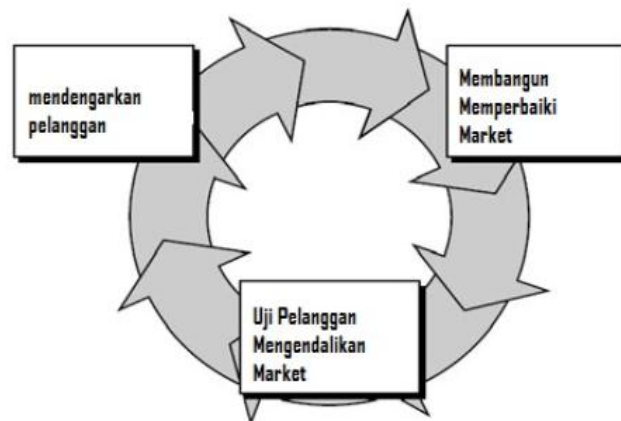
Gambar 1.2 Model Prototype menurut Roger S. Pressman, Ph.D.

Metode pelaksanaan yang diterapkan dalam kegiatan Praktek Kerja Lapang yaitu metode Prototype. Menurut Roger S. Pressman metode Prototype melewati tiga proses, yaitu pengumpulan kebutuhan, perancangan, dan evaluasi Prototype. Proses-proses tersebut dapat dijelaskan sebagai berikut: